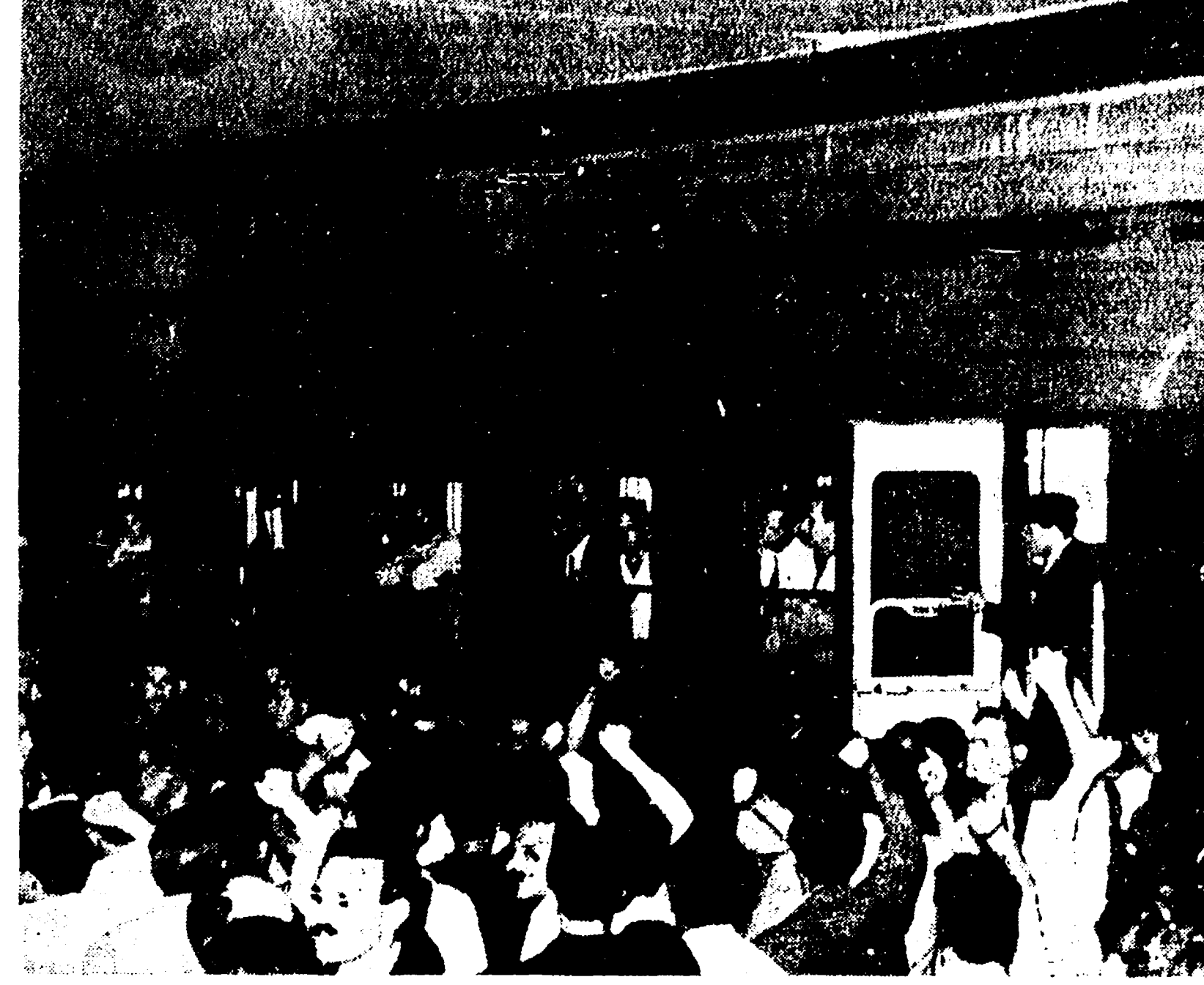
Centinaia di dimostranti circondano il vagone dei delegati romani al congresso fascista

viaggiatori e ferrovieri applaudivano e si associavano alla protesta popolare. A questo punto le forze di polizia, così come è avvenuto nelle altre città, si sono scagliate contro i dimostranti.