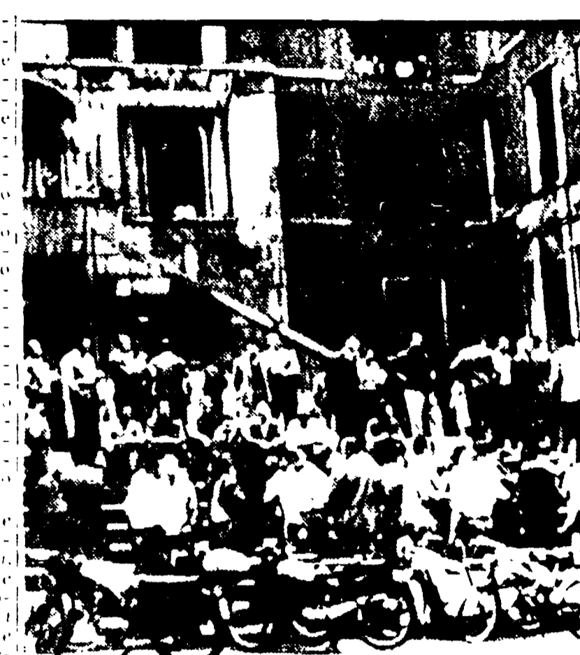
MILANO — Gruppi di operai fuori della sede della Camera del Lavoro mentre si attende la proclamazione dello sciopero