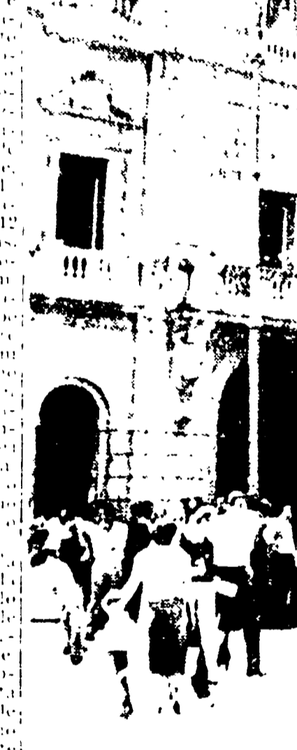
CASTELLAMMARE DI STABIA — Una folla di operai dimostra davanti al municipio

NAPOLI. 7 — Diecimila operai di lavoro in napoletano hanno dato una ferma risposta al governo Tambroni-MSI. Lo sciopero si è esteso a tutte le aziende IRI della città.