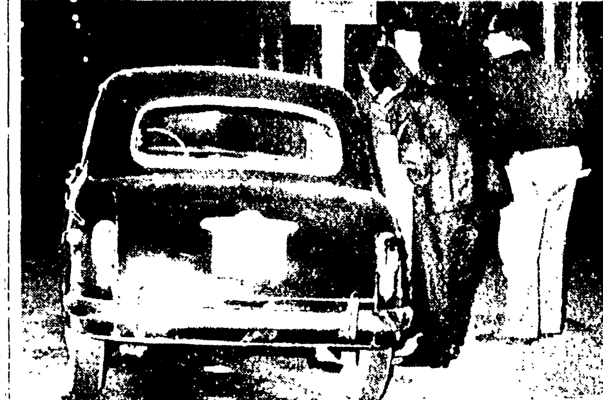
Teppisti fascisti hanno - come è noto - fatta notte lanciando un orfango espositivo contro l'antimilitarista di Carlo Levi, in sosta a Roma in via Nazionale. L'orfano è stato lanciato da una folla nera, avvolta in un fazzoletto di carta. L'orfano di Carlo Levi è qui nella foto dopo l'incidente. Numerosi testimoni, a testimonianza di solidarietà nei confronti di un illustre scrittore, antifascista e antifascista, si sono presentati al ministero degli Interni per conoscere esse sono stati individuati e punti i teppisti fascisti responsabili del vile attentato contro l'antimilitarista di Carlo Levi, esponente della Resistenza e nobile rappresentante della cultura democratica e antifascista italiana.

Alcuni dei teppisti fascisti, come è noto, sono stati individuati e punti. I teppisti fascisti responsabili del vile attentato contro l'antimilitarista di Carlo Levi, esponente della Resistenza e nobile rappresentante della cultura democratica e antifascista italiana.