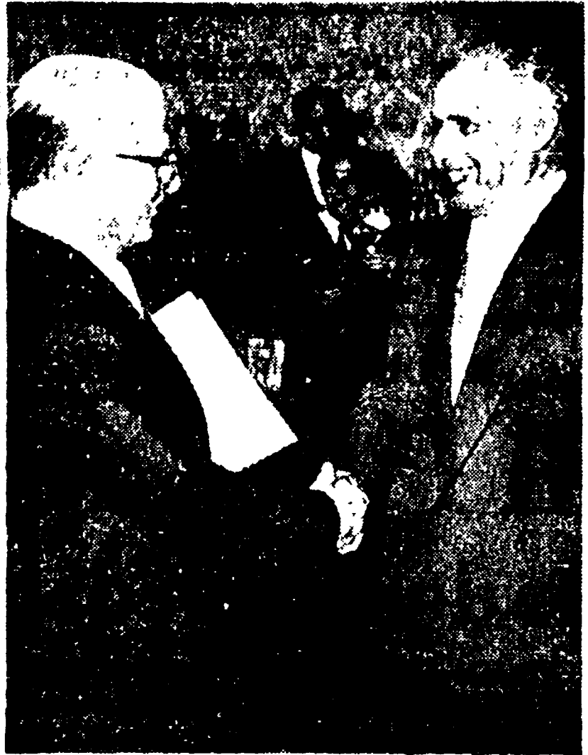
Il presidente della Repubblica tunisina Habib Bourguiba, che si trova in Italia in visita privata, ha reso visita ieri al Quirinale al presidente Gronchi...