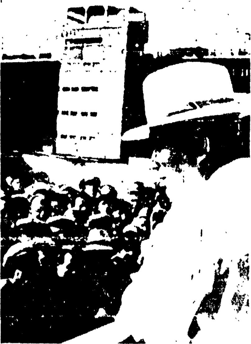
STALINGRADO — Krusciov parla ai lavoratori che stanno costruendo la grande centrale idroelettrica.

Sul delta del Volga è stato raggiunto da Ulbricht e Kadar - La visita a un nuovo grosso impianto per la produzione di cellulosa - I dirigenti del PCUS intervengono nelle assemblee di discussione sull'ultima sessione del Comitato Centrale