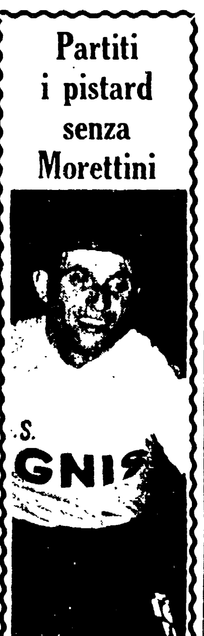
Partiti i pistard senza Morettini