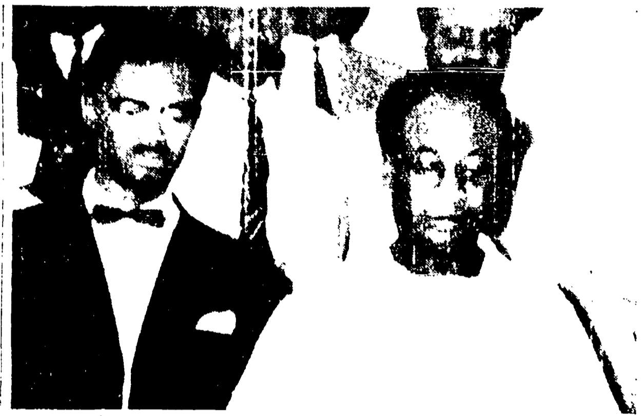
Il premier congolese Lumumba e il presidente del Ghana Nkrumah