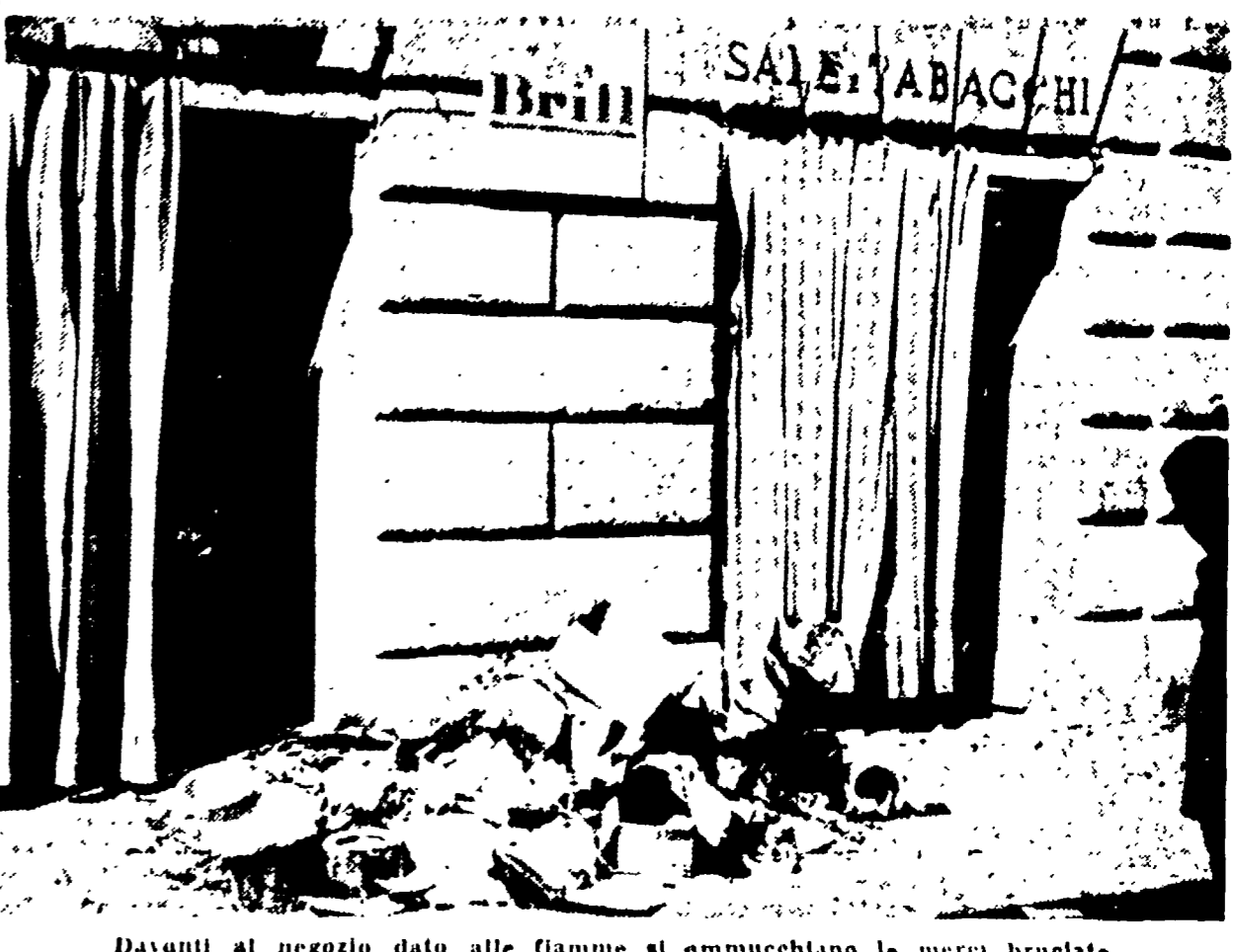
Davanti al negozio dato alle fiamme si ammucchiano le merci bruciate