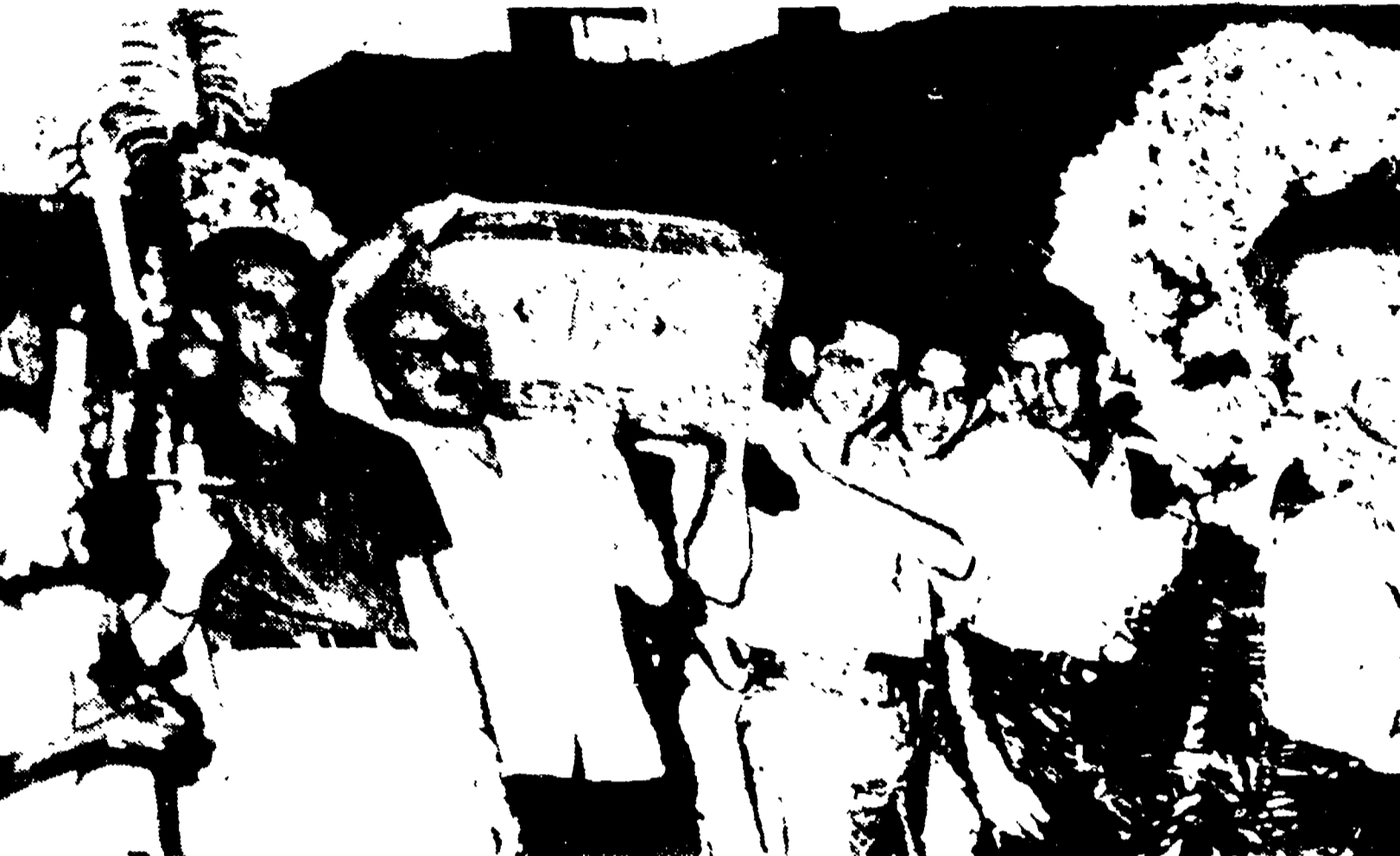
L'AVANA - Cuba è in festa per la liberazione dell'isola dallo sfruttamento delle compagnie finanziarie degli Stati Uniti. Una pittoresca manifestazione si è svolta ieri nella capitale davanti al Campidoglio, sede del Parlamento, sono state deposte ventisei bare che recano ciascuna il nome di una delle 26 imprese USA espropriate...