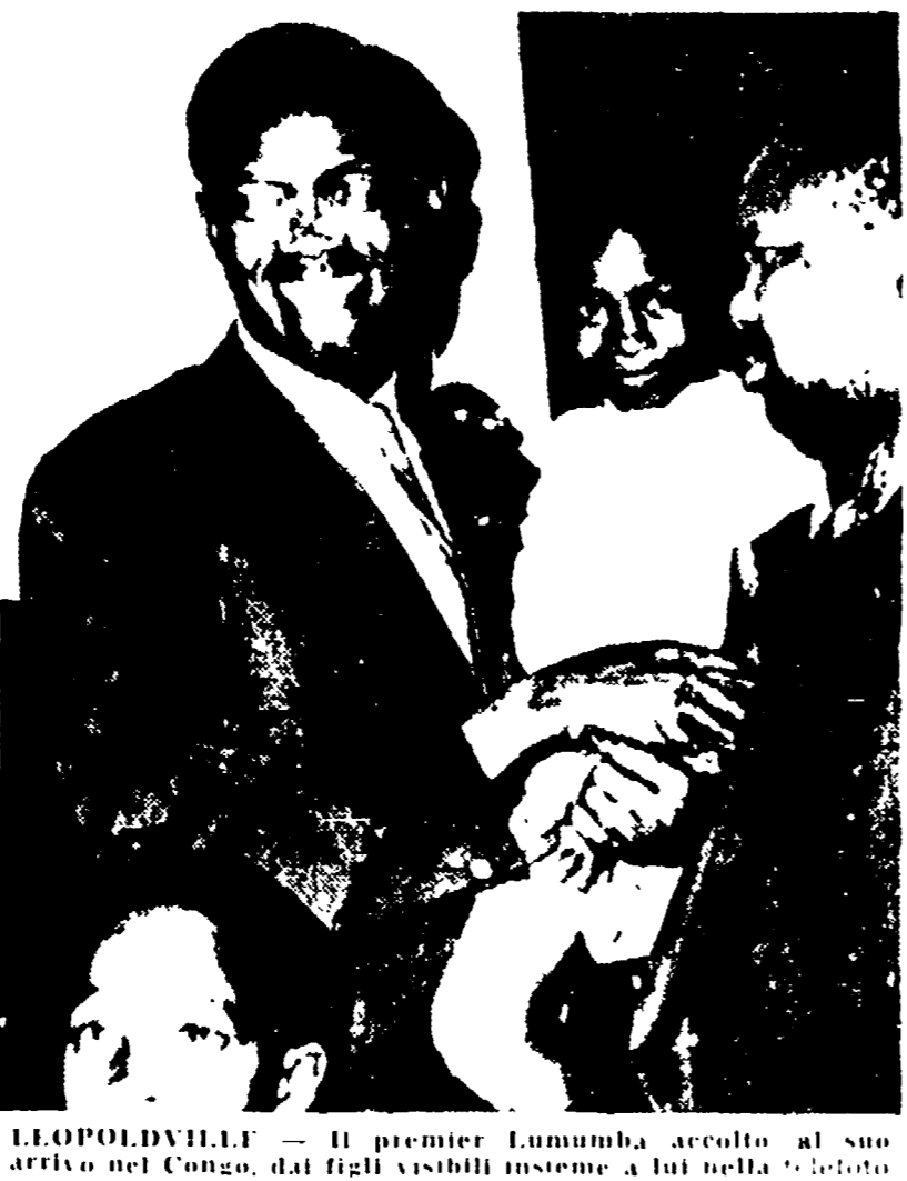
LEOPOLDVILLE. Il premier Lumumba accolto al suo arrivo nel Congo, dai figli visibili insieme a lui nella foto.