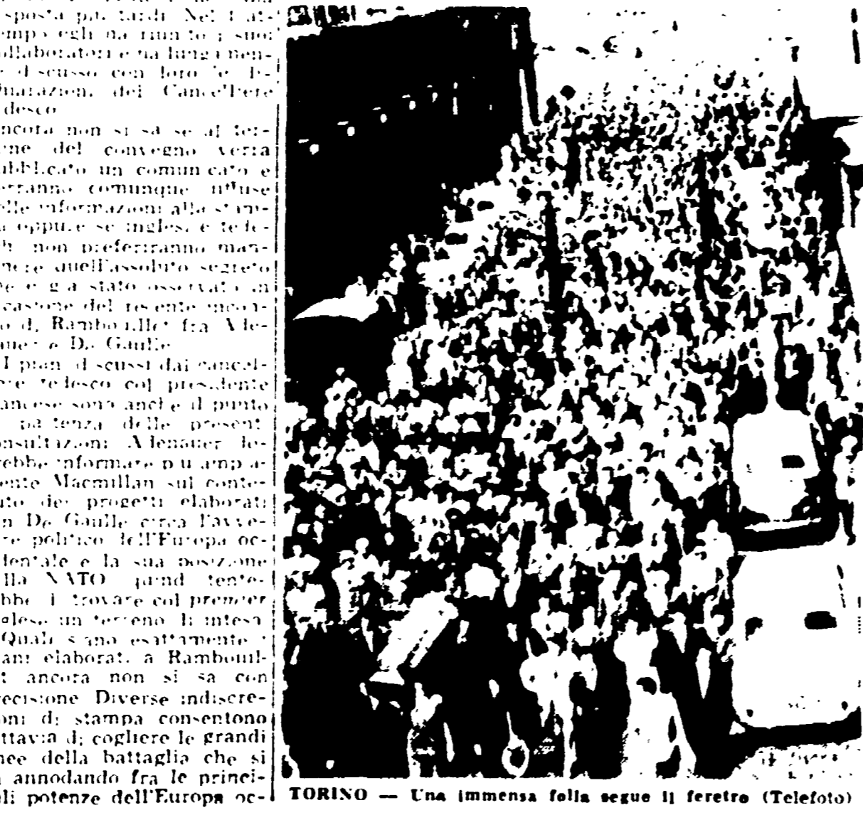
TORINO. Una immensa folla segue il feretro (Telefoto)