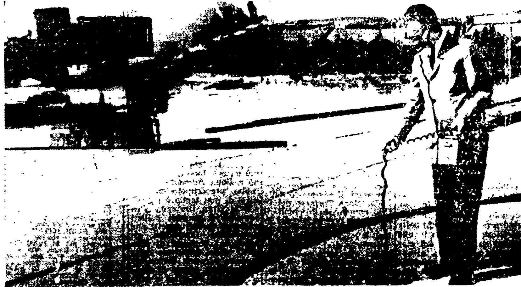
BOSTON - Nel porto di Boston si è verificato l'incendio e l'esplosione di un deposito di scorie di materiale radioattivo destinato ad essere gettate in mare...