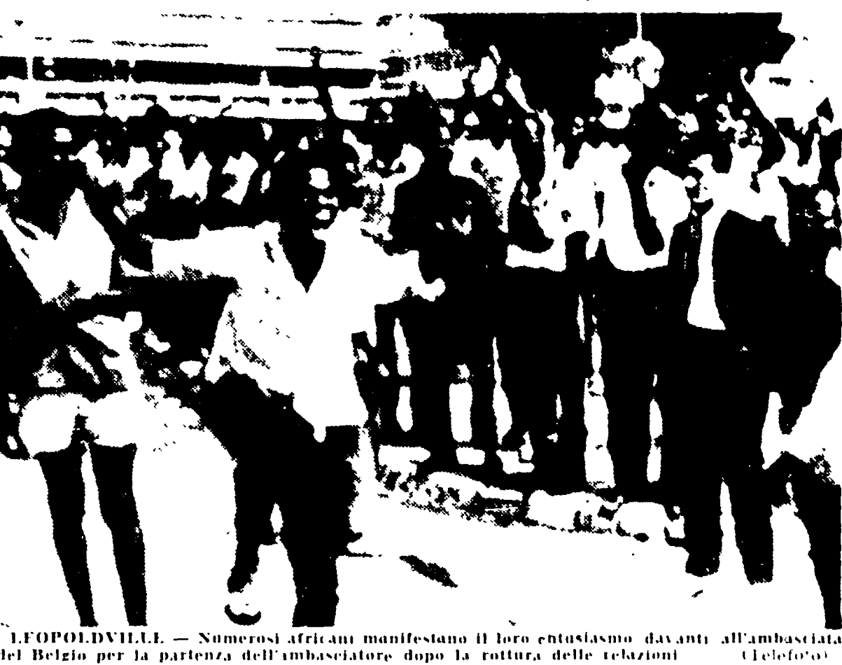
LEOPOLDVILLE. - Numerosi africani manifestano il loro entusiasmo davanti all'ambasciata del Belgio per la partenza dell'ambasciatore dopo la rottura delle relazioni diplomatiche.

L'agenzia di notizie "Belga", è stata chiusa dal governo congolese - Appello del premier Lumumba per l'integrità del territorio nazionale