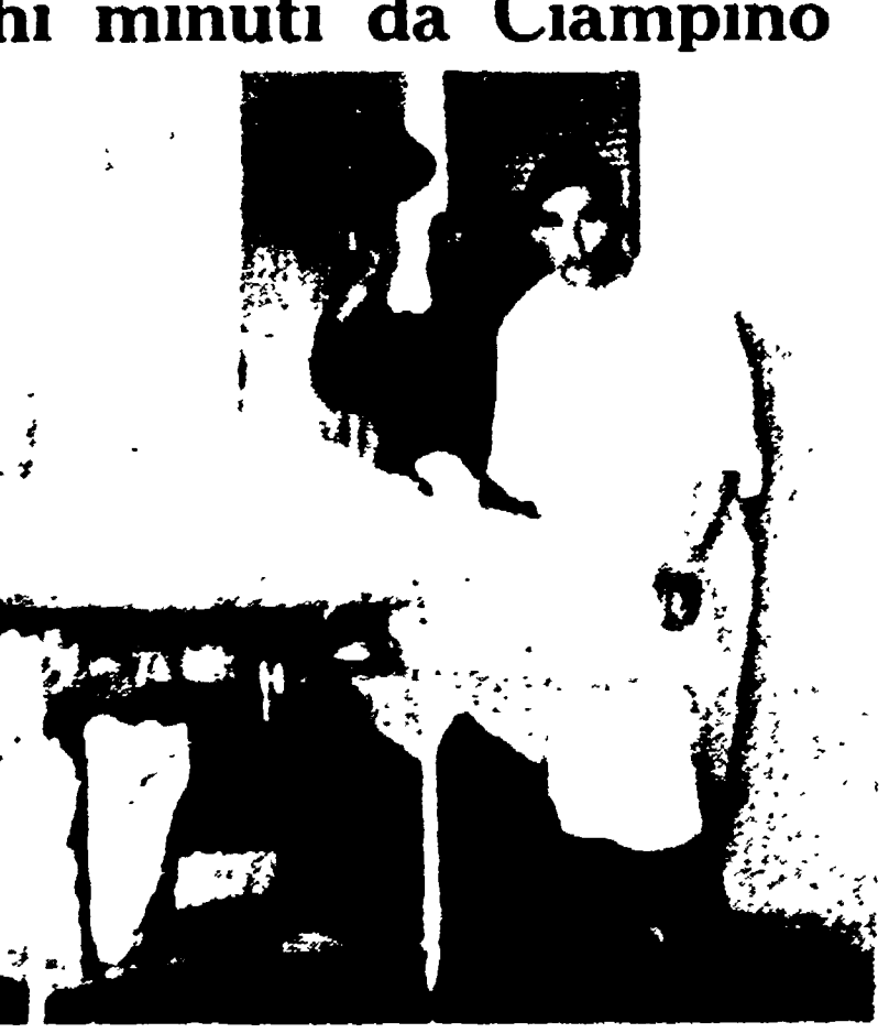
Uno dei feriti nell'incidente aereo viene trasportato all'ospedale San Giovanni