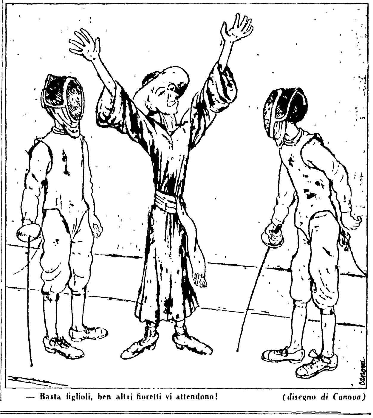
Basta figlioli, ben altri fioretti vi attendono!