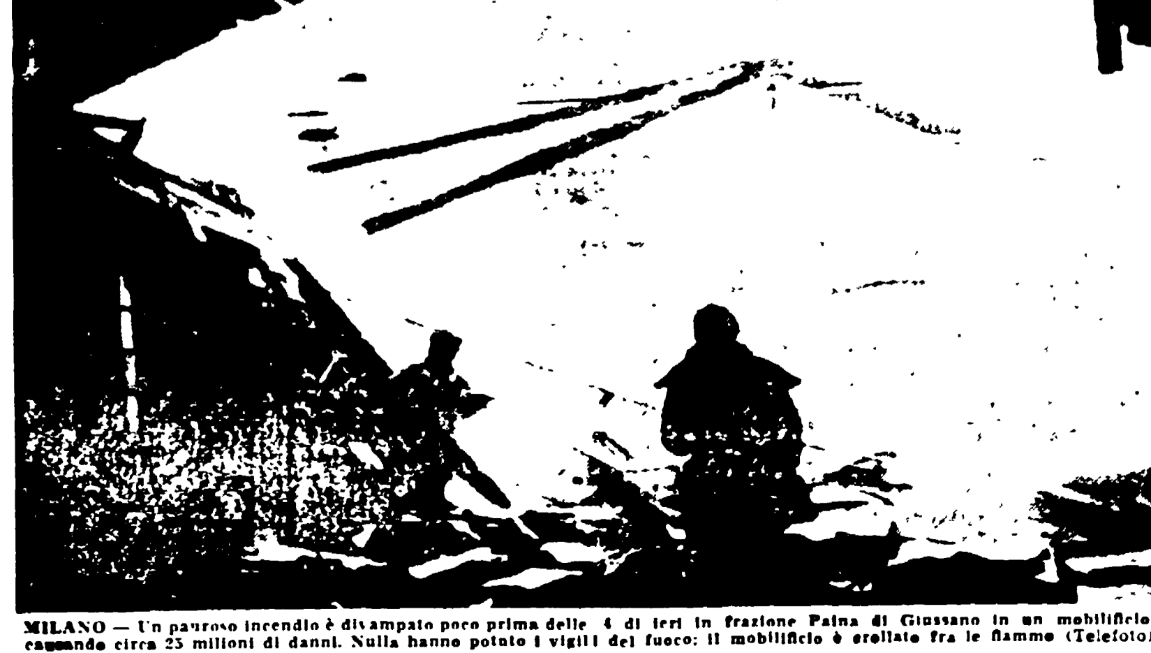
MILANO - Un pauroso incendio è divampato poco prima delle 4 di ieri in frazione Palma di Giussano in un mobilificio, causando circa 25 milioni di danni. Nulla hanno potuto i vigili del fuoco: il mobilificio è crollato fra le fiamme.