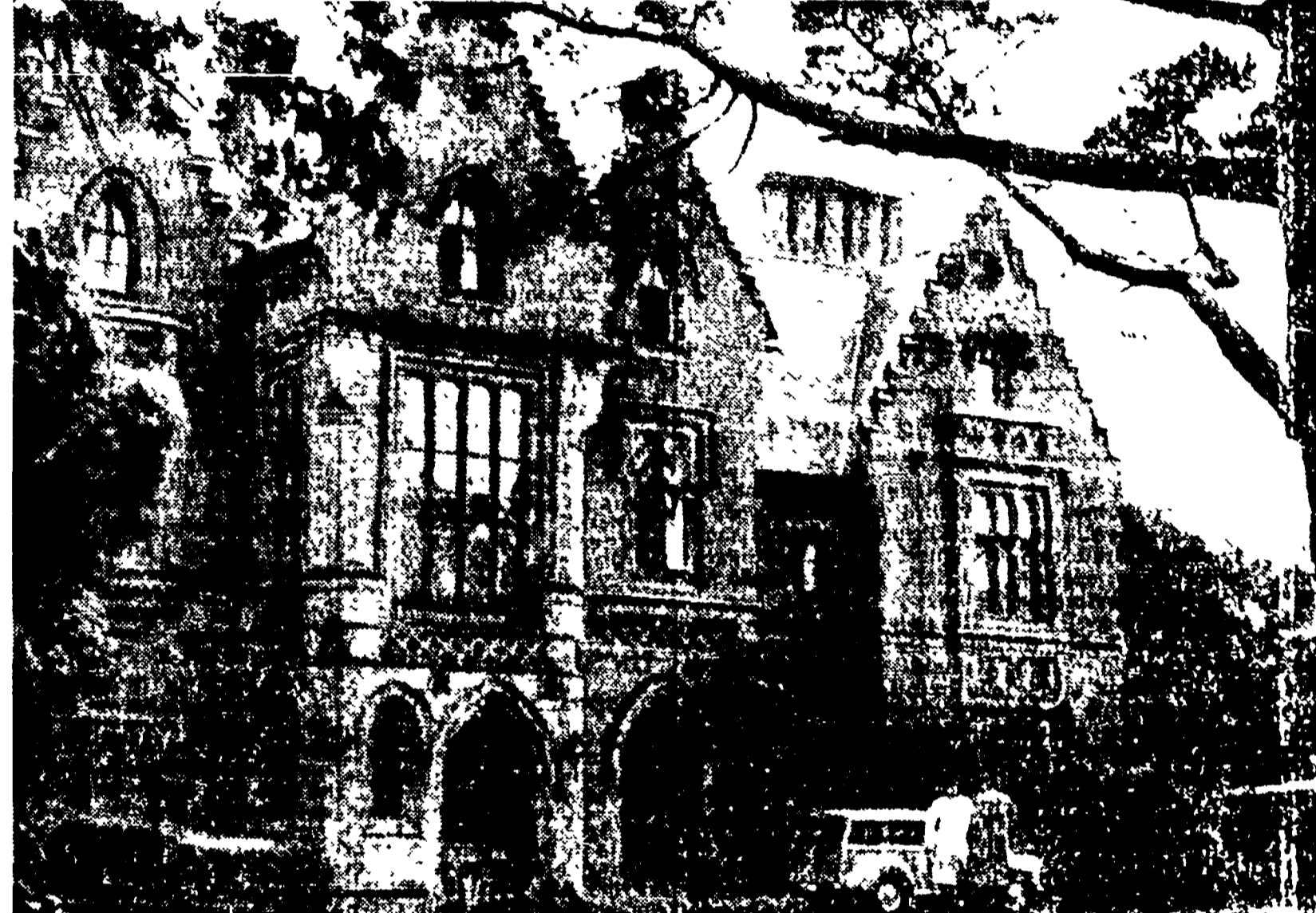
COBHAM (Surrey - Inghilterra) - Una veduta del sontuoso castello «Lewer Park» che l'attrice Elizabeth Taylor ed il marito, il cantante Eddie Fisher, hanno affittato per sei mesi per 100.000 lire settimanali. La fastosa dimora è composta di quindici camere da letto, cinque salotti, sei stanze da bagno e una piscina.