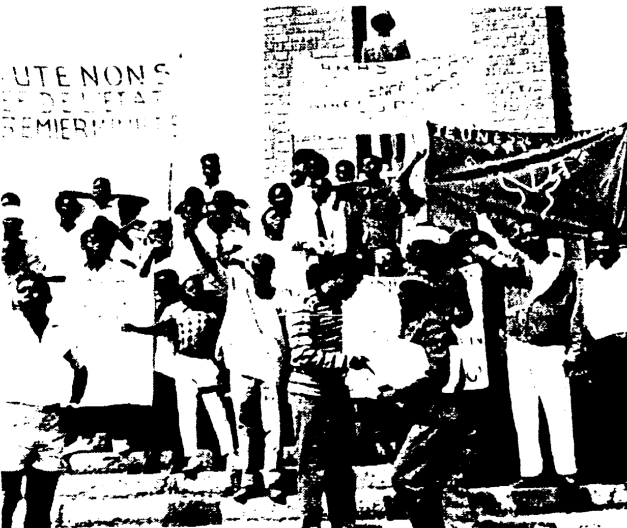
LEOPOLDVILLE - Un gruppo di giovani congolese componenti dell'organizzazione Gioventù Popolare Africana...

Il primo ministro congolese propone la creazione di una delegazione di 14 paesi afro-asiatici - Convocato il Consiglio di Sicurezza - Uccisi nel Katanga 12 manifestanti che chiedevano l'unità del Congo