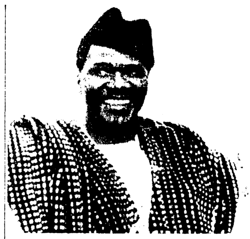
Il presidente della Guinea Seku Turé