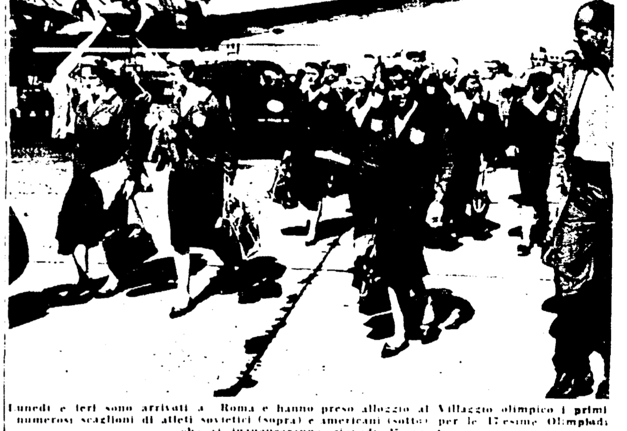
Lunedì e ieri sono arrivati a Roma e hanno preso alloggio al Villaggio olimpico i primi numerosi scagioni di atleti sovietici e americani...