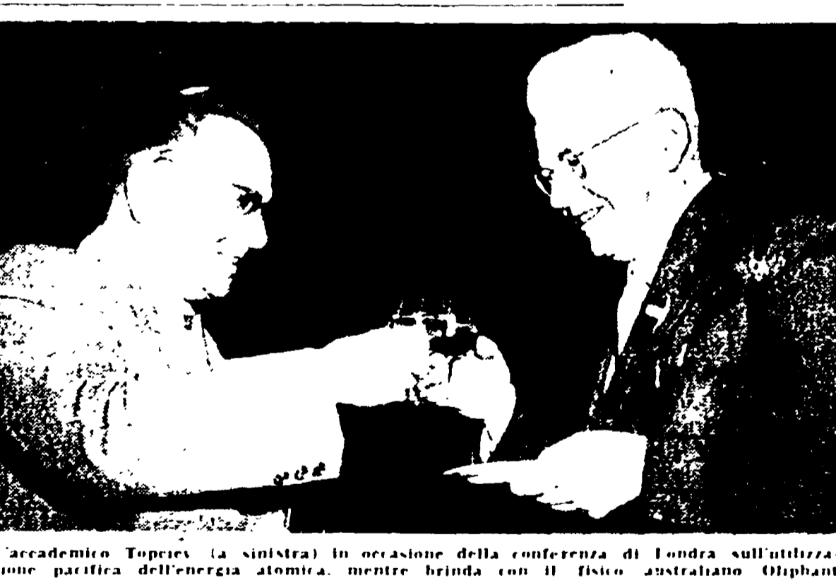
L'accademico Topceev (a sinistra) in occasione della conferenza di Londra sull'utilizzazione pacifica dell'energia atomica, mentre brinda con il fisico australiano Oliphant

(Dalla nostra redazione) MOSCA, 24 - Abbiamo finalmente visto e accertato Bielka e Strielka, le sole creature viventi tornate da un volo cosmico. Dalla bocca degli scienziati che ne hanno guidato l'allenamento cosmico, abbiamo udito il racconto della grande impresa spaziale. Numerosi particolari di questa impresa sono stati ampiamente illustrati da sei accademici dell'URSS.