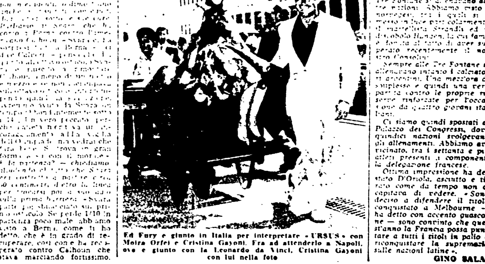
Ed Fury e gli altri in Italia per interpretare «URSS» con Moira Orfei e Cristina Gasponi. Fra ad attenderlo a Napoli, sve e giunto con la Leonarda di Inci, Cristina Gasponi con lui nella foto

Le ostacoli, questa volta, sono di natura diversa. Si tratta di una gara di velocità, cronometro a squadre, alle 13 nuoto femminile (100 metri x 4) e poi dal «Flamingo» il secondo tempo di Polonia-Liopia di calcio, alle 15 canoa su pista (100 metri x 4) cronometro e nuoto.