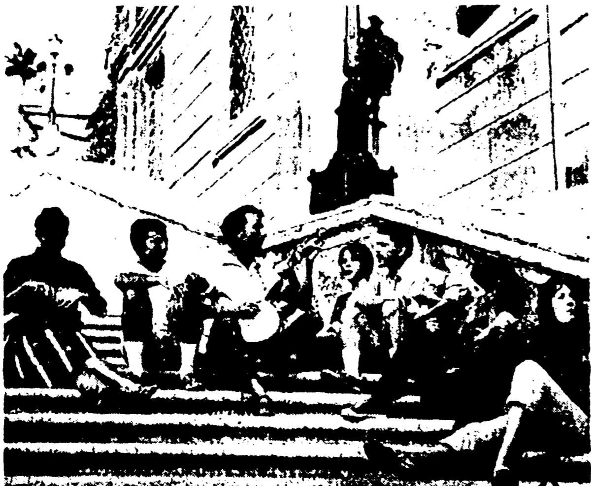
Con un banjo e molto buon umore, un gruppo di giovani turisti inglesi ha trascorso un pomeriggio sulla scalinata di Trinità dei Monti, infilandosi anche del caldo tropicale. Forse volevano passare il tempo, forse cercavano un po' di pubblicità del pubblico, però, come ci mostra la foto, hanno dovuto fare a meno...

Rapina in un appartamento di largo del Pallaro