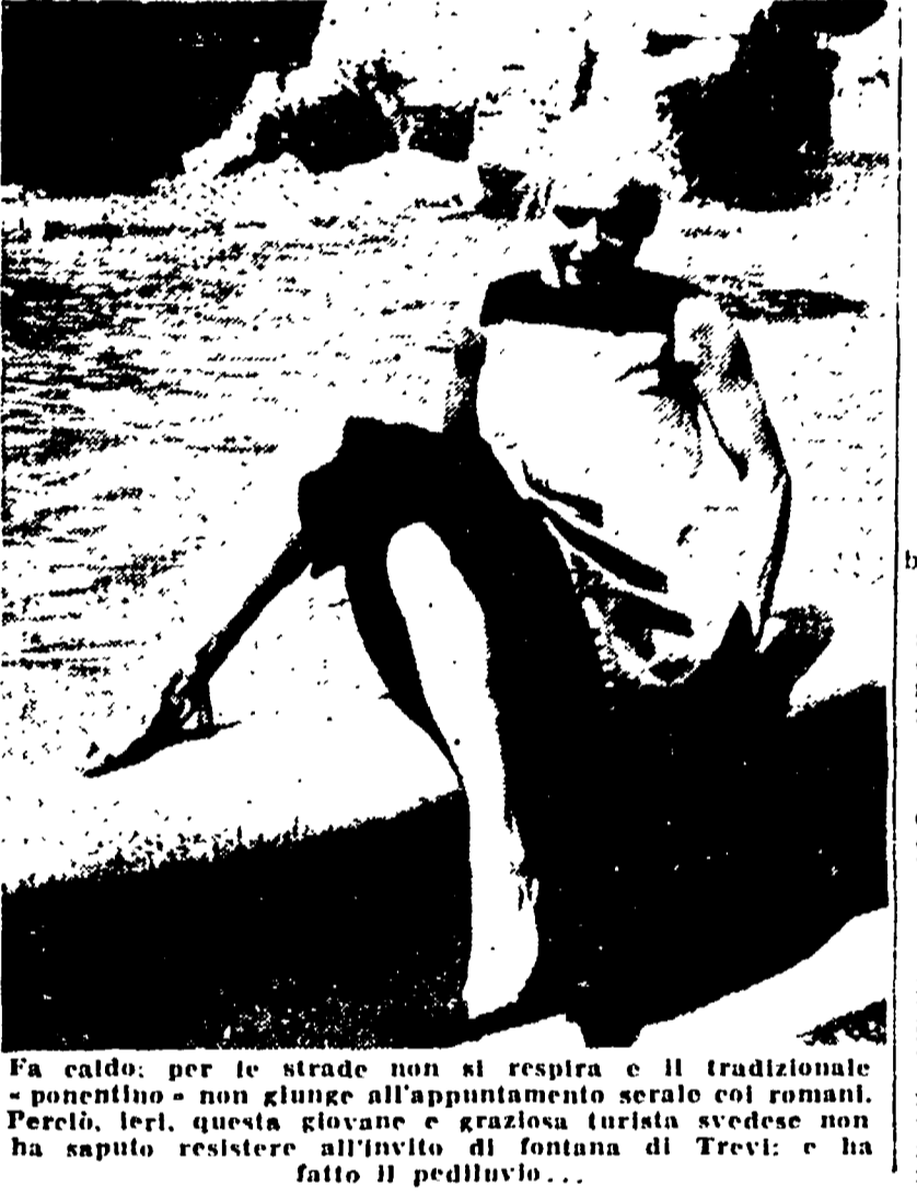
Fa caldo, per le strade non si respira e il tradizionale pediluvio - non giunge all'appuntamento serale coi romani. Perù, ieri, questa giovane e graziosa turista svedese non ha saputo resistere all'invito di fontana di Trevi; e ha fatto il pediluvio...

«... e chiudere un occhio sulla libertà dei modi e di costumi delle belle ragazze nordiche che è stato riferito di una scandinava quasi nuda, serena e favelata da un'importatissima svedese e affascinato reporter, capitato per ragioni di lavoro nell'ospedale conventuale. Questo ragazzo, un appartenente del turista e fu il «fatto del fatto» che gli organi di stampa si sono accorti di non pagare tasse, e godono di una influenza dilatata e incontrastata su tutte le autorità governative, a tutti i livelli: favore di fatto, facile e maligna ironia sulla delusione dei commercianti, ecco di che cosa dovrebbe parlare il «Popolo», spiegando che non si tratta di un fatto di tutto questo e giusto, se tutto questo corrisponde alla sbandierata libertà di commercio, e a tutti quei principi che solo mente vengono esaltati in tempo di elezioni, per accaparrarsi i voti dei commercianti. «I conti, in casa, fra noi, ce li faremo i fuochi spenti».