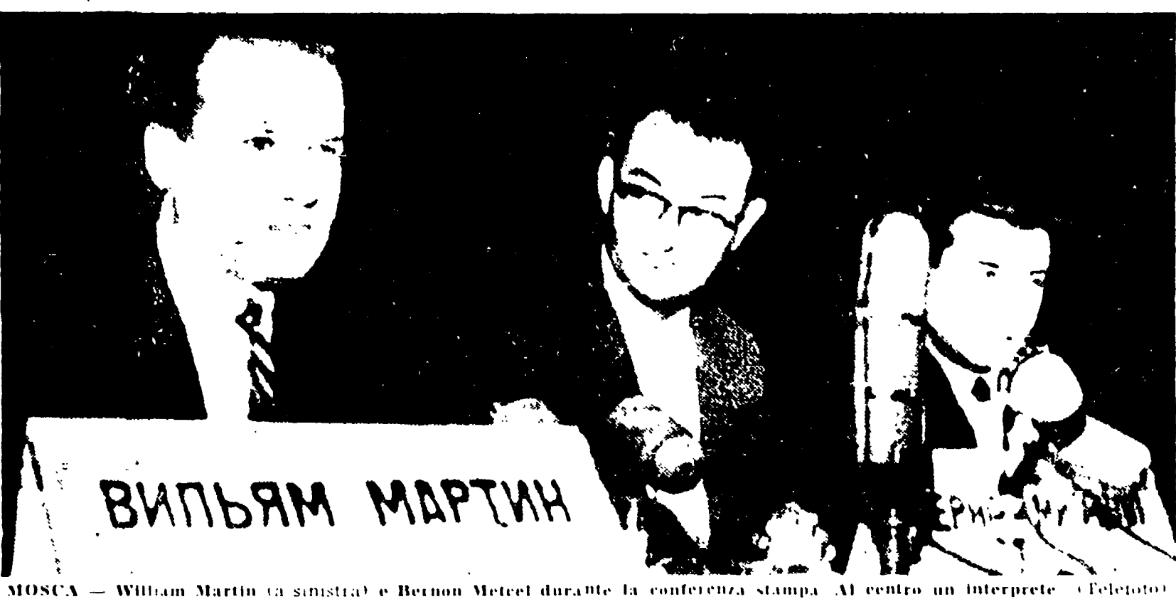
MOSCA - William Martin (a sinistra) e Bernon Mitchell durante la conferenza stampa. Al centro un interprete

Martin e Mitchell, esponenti della centrale di spionaggio NSA, hanno chiesto la cittadinanza sovietica perché indignati dalla politica di guerra USA - Anche la corrispondenza cifrata dell'Italia intercettata da Washington