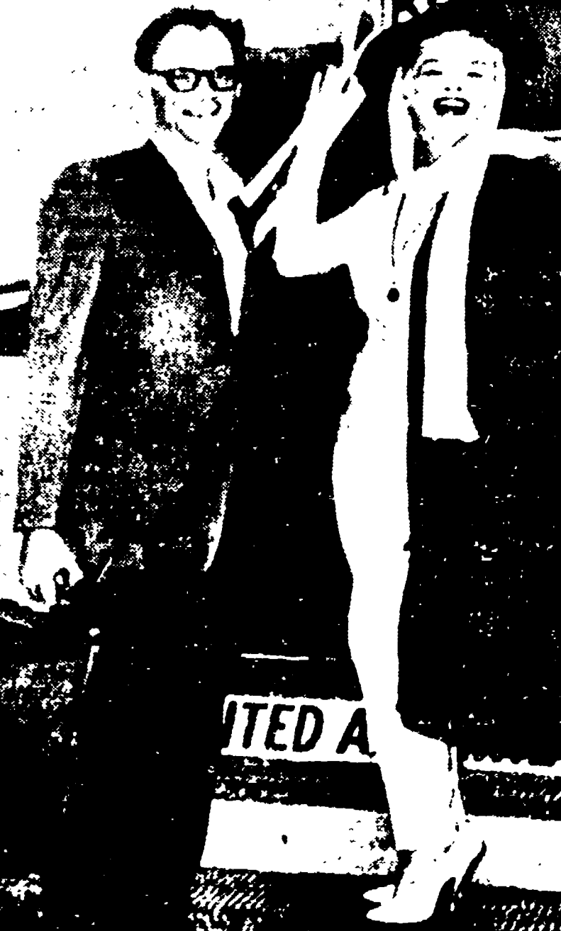
HOLLYWOOD — Marilyn Monroe ha lasciato la clinica dove era stata ricoverata a causa di un esaurimento nervoso. Il suo compagno, Arthur Miller, si è immediatamente recato in aereo per Reno, per riprendere la lavorazione del film con Clark Gable interrotta. Nella foto Marilyn ed Arthur Miller sorridono sulla scia della partenza dell'aereo ad Hollywood poco prima della partenza.