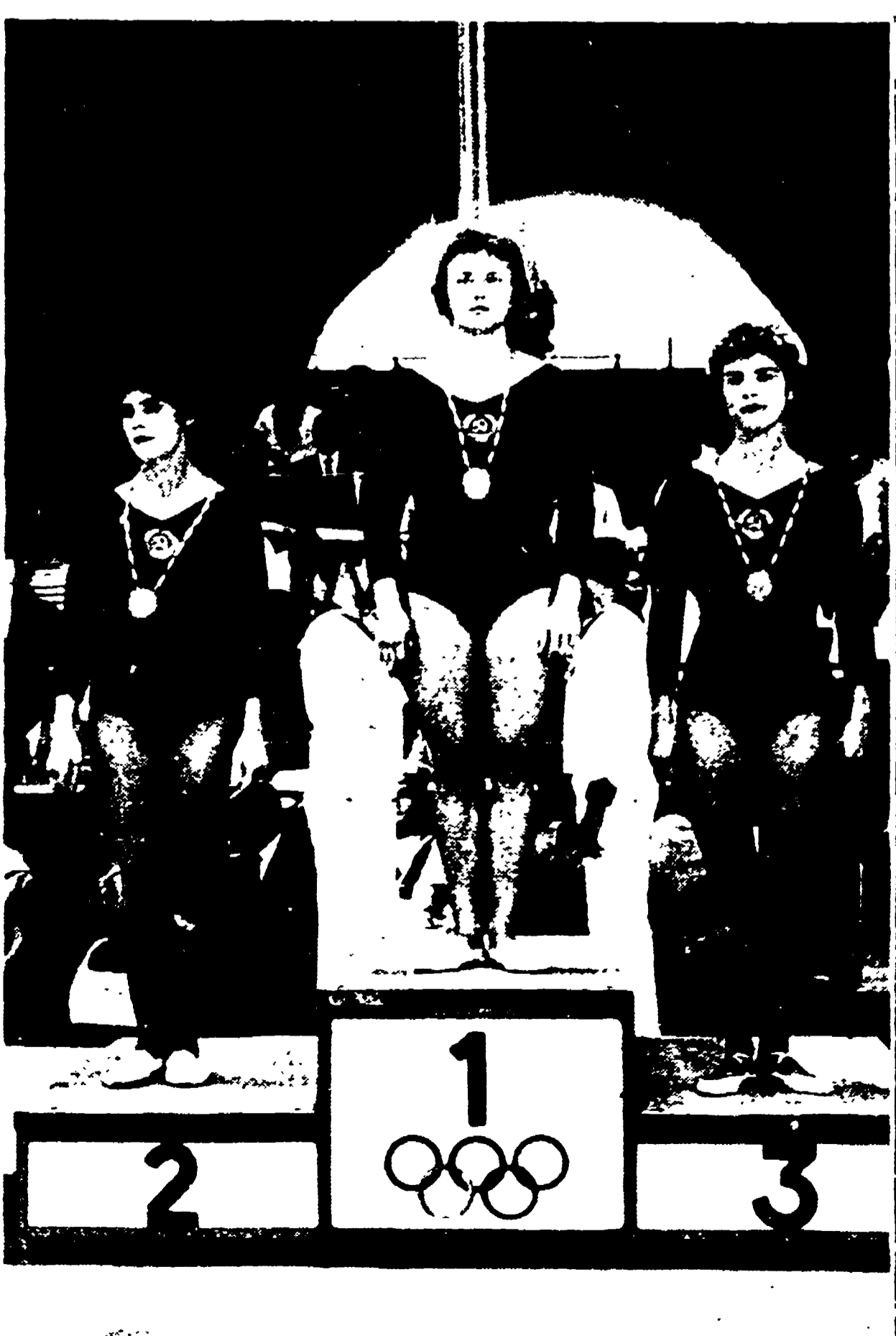
Tre medaglie (d'oro, d'argento e di bronzo) per l'URSS nell'esercizio del salto del cavallo, una delle specialità della ginnastica. Ha vinto la Nikolaeva (al centro) seguita dalle connazionali Muratova (a sinistra) e Ljukina.

Alle ragazze dell'URSS le medaglie d'oro nel cavallo, nelle parallele e nel corpo libero e tutte le medaglie d'argento e di bronzo in palio - Alla Bosakova il titolo della trave