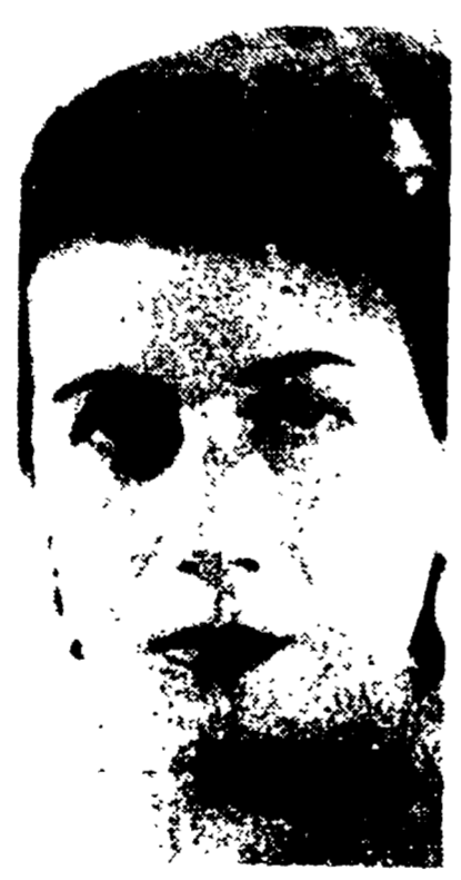
Lo studente assassino

La lotta è stata tremenda: ne sono tracce in tutto l'appartamento. Il giovane più tardi ha ripetuto la confessione di fronte al sostituto Procuratore dott. Meucci.