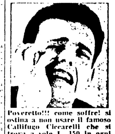
Poveretti! Come soffrirli si ostina a non usare il famoso Caffilgno Clearelli che si trova a sole L. 150 in ogni farmacia!

BEIRUT, 10. — Una bomba è esplosa questa mattina a Beirut davanti alla sede del consolato generale della R.A.L. provocando leggeri danni e un ferito.