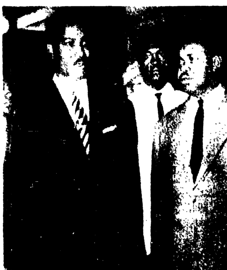
NEW YORK - L'arrivo della legittima delegazione congolese all'ONU. In primo piano Thomas Kanza

La situazione scappata nel Congo da quando il Ghana ha posto le sue truppe a disposizione dell'ONU ha periferato il reale obiettivo delle Nazioni Unite e preannuncia severamente la posizione del Ghana agli occhi del legittimo governo congolese.