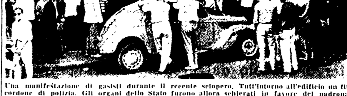
Una manifestazione di gasisti durante il recente sciopero. Tutt'intorno all'edificio un fitto cordone di polizia. Gli organi dello Stato furono allora schierati in favore del padronato