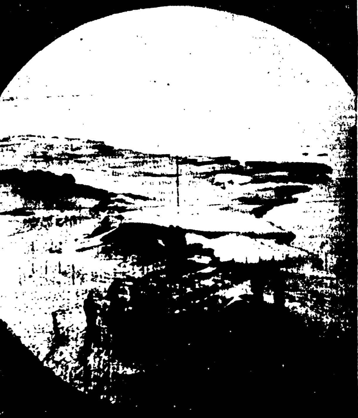
WASHINGTON - Questa foto, rilasciata ieri dal ministero della Marina americana, mostra alcuni membri dell'equipaggio che passeggiano sulla banchisa del Polo Nord...