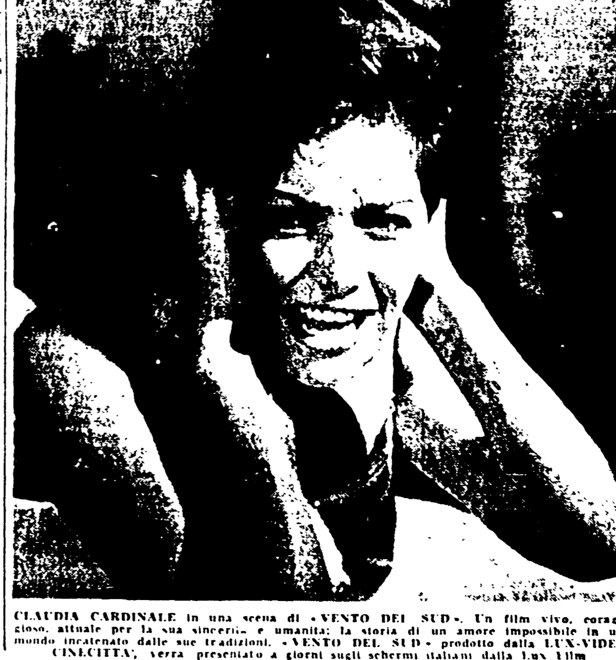
CLAUDIA CARDINALE in una scena di «VENTO DEL SUD». Un film viva, coraggioso, attuale per la sua sincerità e umanità; la storia di un amore impossibile in un mondo incatenato dalle sue tradizioni. «VENTO DEL SUD» prodotto dalla LUX-VIDES CINECITTÀ, verrà presentato a giorni sugli schermi italiani dalla Lux Film.