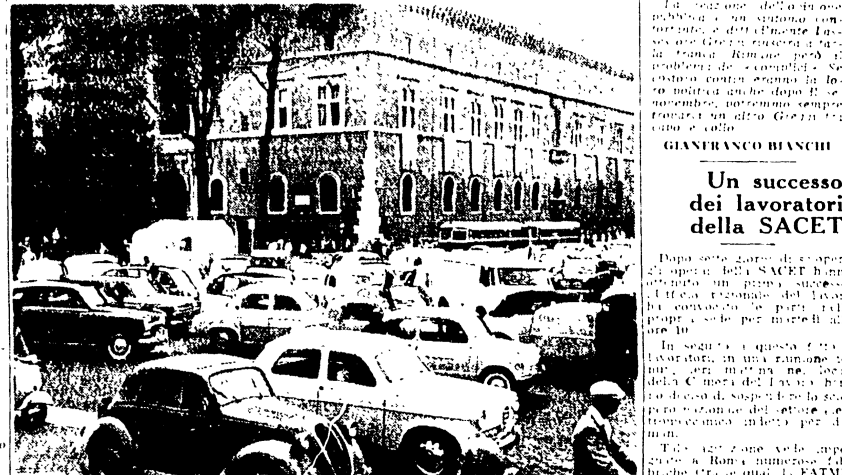
Traffico paralizzato in un'ora di punta a Piazza Venezia

Il «Quotidiano» non sta facendo un lavoro di inchiesta per il traffico. L'altro ieri, se ne è parlato con un certo numero di esponenti del partito, che avevano preso la parola per esprimere il loro parere sul problema.