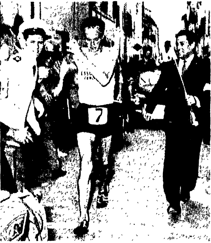
Il vittorioso arrivo di ABDON PAMICH

grado ciò a migliorare il tempo di Dordoni che nella stessa gara ottenne 5' in meno.