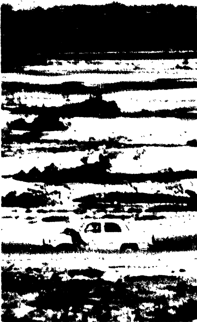
Al km 103 dell'Aurelia, una «Giuletta» caduta in acqua in seguito al crollo del ponte, è rimasta bloccata nella melma. Marito e moglie, che si trovavano a bordo sono stati tratti in salvo dopo tre ore nella foto uno degli occupanti aggrappato alla macchina