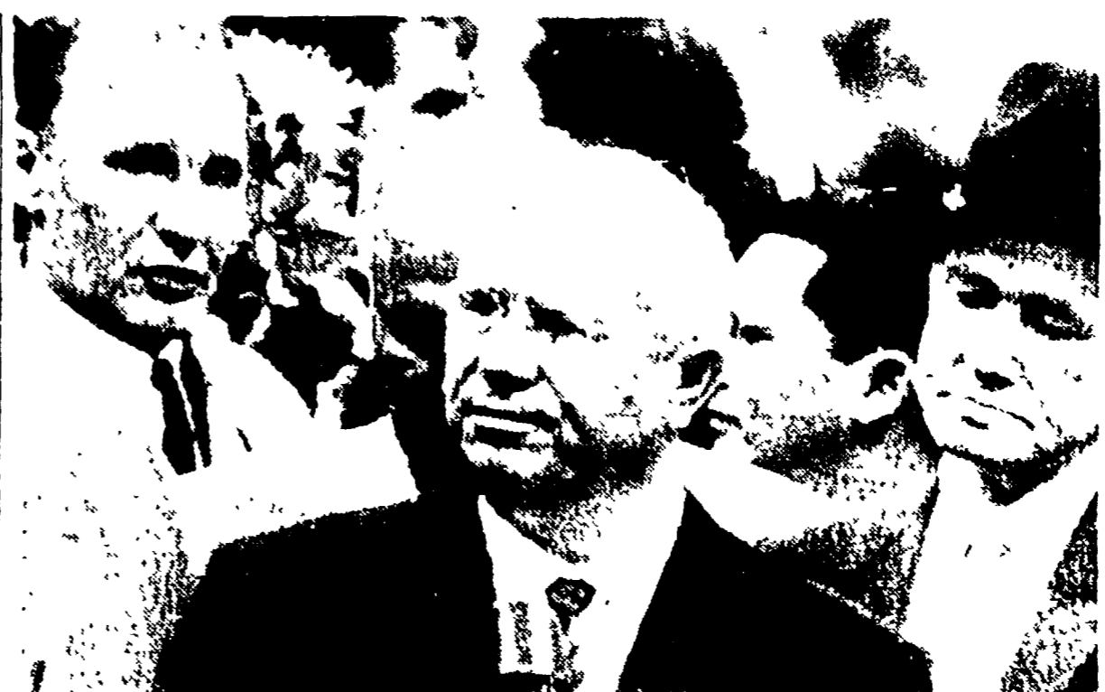
NEW YORK - Krusciov mentre parla al microfono subito dopo lo sbarco a New York. Al suo fianco (a sinistra) il capo della delegazione ungherese, Kadar, e il leader del partito comunista ungherese, Gombas