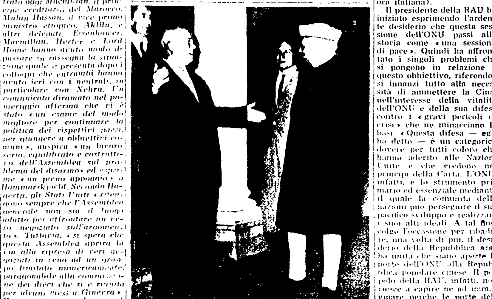
NEW YORK - Krusciov che con le braccia spalancate augura la buona notte al Pandit Nehru al termine del pranzo che il premier sovietico ha offerto in onore del premier indiano

Nel suo discorso Nasser ha attaccato duramente l'azione dell'ONU, nel Congo e ha proposto l'ammissione della Cina