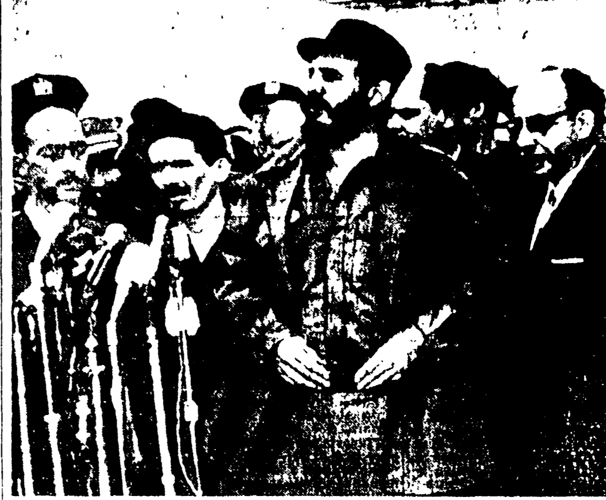
L'AVANA — Fidel Castro è ritornato oggi all'Avana proveniente da New York, da cui è partito a bordo di un aereo messo a sua disposizione dalla delegazione sovietica. L'aereo era stato infatti sequestrato illegalmente dalle autorità statunitensi. Una folla enorme ha accolto con calorose ed entusiastiche manifestazioni. Castro è salito al centro del Plaza durante il suo discorso poco lungi dalla piazza ove parlava. I tentativi attentatori hanno lanciato bombe che non hanno provocato né danni, né feriti.