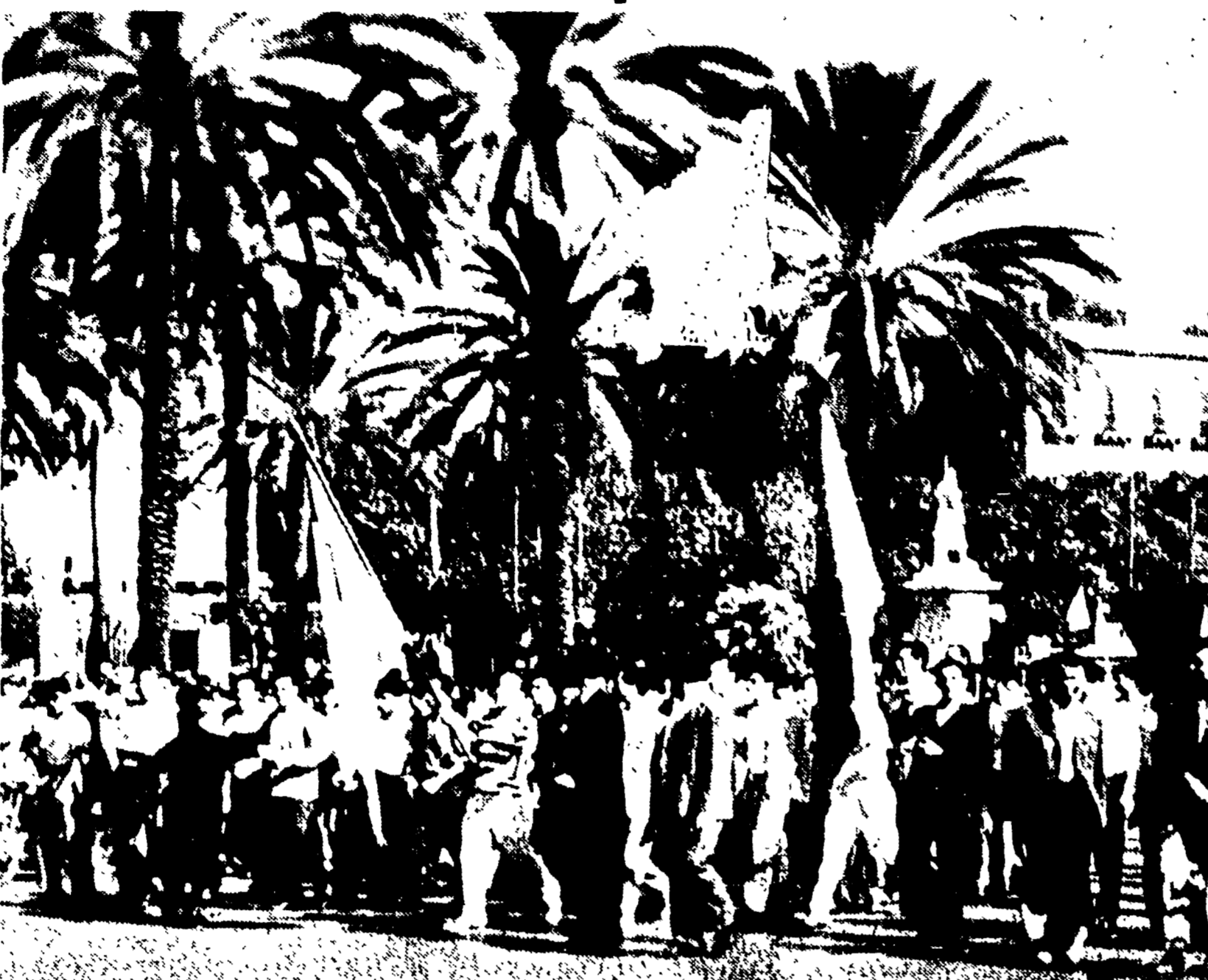
PALERMO - Si è svolto ieri con grandiosa partecipazione l'annunciato sciopero generale contro i sabati di tipo coloniale...