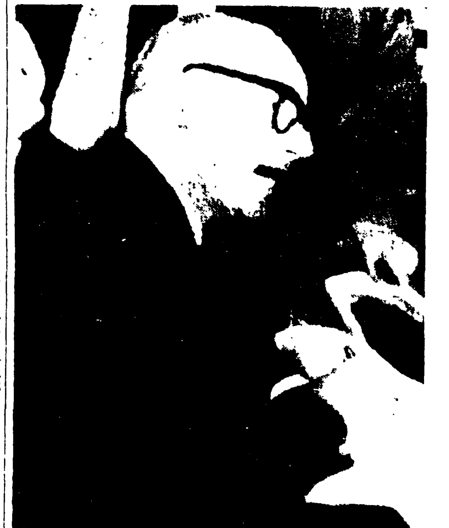
RIO DE JANEIRO - Juanio Quadros, candidato del centro destra, è finora in testa negli scrutini parziali delle schede per l'elezione del Presidente con 712.235 voti contro 401.837 del candidato delle sinistre Henrique Teixeira Lott. Nella foto: Teixeira Lott mentre vota.