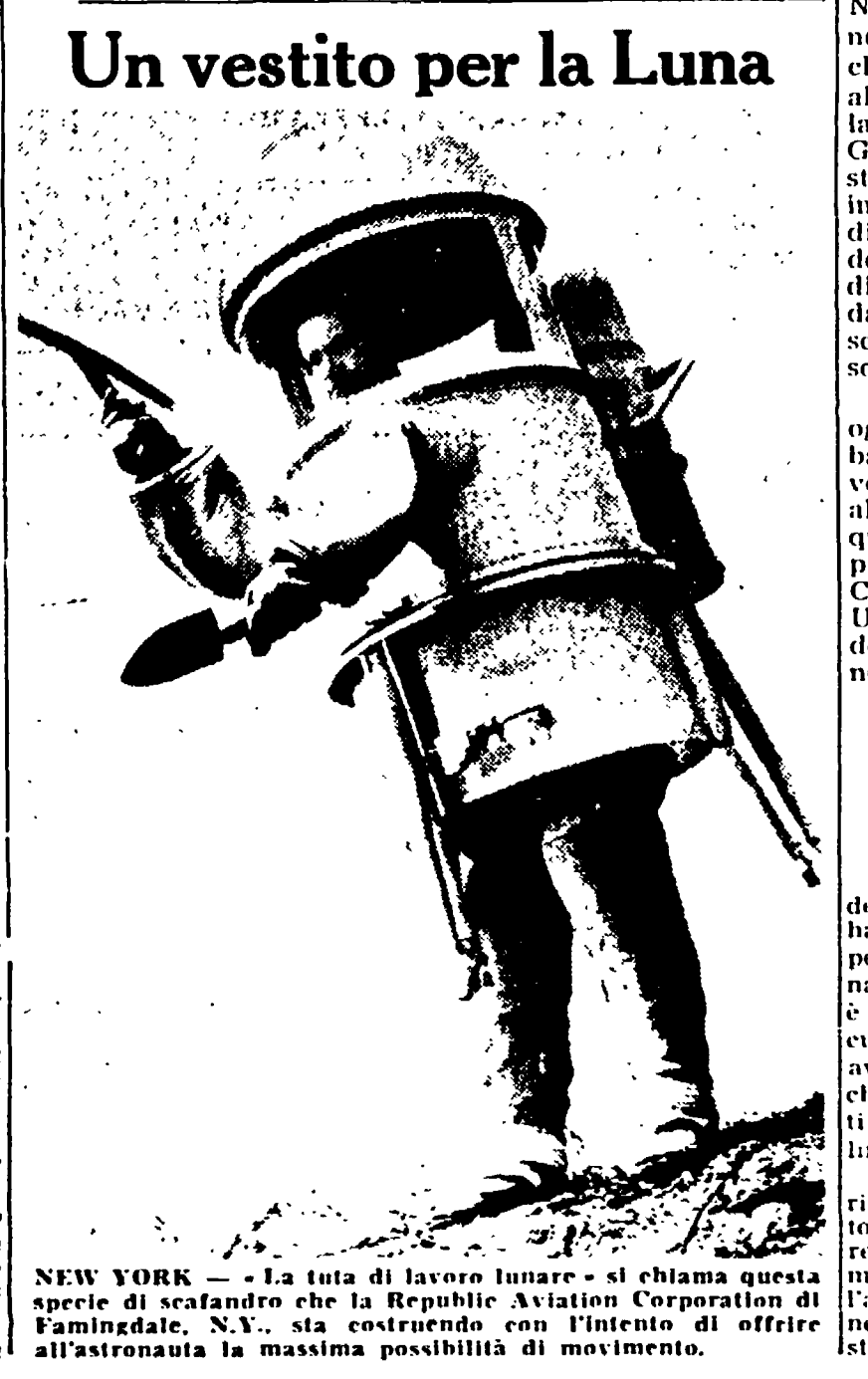
NEW YORK. — La tuta di lavoro lunare che si chiama questa specie di scafandro che la Republic Aviation Corporation di Farmingdale, N.Y., sta costruendo con l'intento di offrire all'astronauta la massima possibilità di movimento.

La manifestazione nazionale proposta dall'Unione studenti è stata accolta con più evidente favore da una parte della sinistra: quella che va dal PSU all'organizzazione democratica degli ex-combattenti d'Algeria (presieduta dal direttore dell'« Express »).