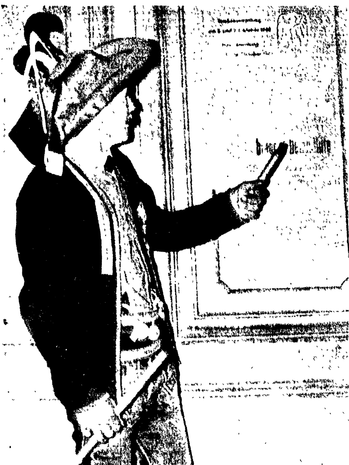
INNSBRUCK — Sabato sera i nazisti tirolesi e altoatesini si sono divertiti a inscenare una delle macabre manifestazioni, a base di bandiere abbrunate, care ai fascisti. In occasione del 10. anniversario della «annessione del Sudtirolo all'Italia». Nella foto un «Schutzen» (ovvero «tiratore scelto») dell'Alto Adige, in servizio in Austria per l'occasione. Illumina una scritta che dice, in tedesco: «Il Tirolo ha bisogno del vostro aiuto».