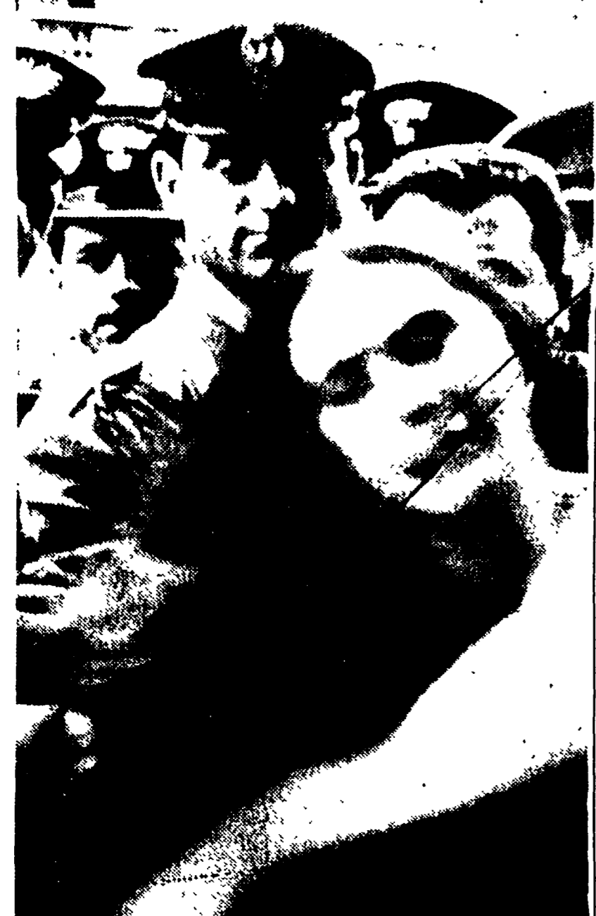
Una delle donne malmenate dinanzi la prefettura, viene allontanata dal luogo dello scontro con la polizia

Tra le molte donne di Campidoglio, degli uomini democristiani del sottogoverno, e dunque anche i signori del Palazzo di Torre Spaccata che si impadroniscono di questa settore della edilizia popolare della quale, nella nostra città, è tutto il sogno.