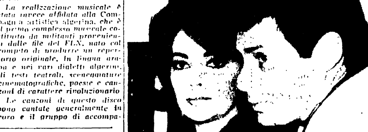
LONDRA. — Elizabeth Taylor, malata e seria, entra in clinica accompagnata dal marito Eddie Fisher.

LONDRA, 31. — Elizabeth Taylor, malata e seria, entra in clinica accompagnata dal marito Eddie Fisher.