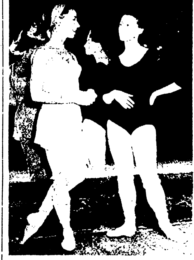
La ballerina inglese Nadya Nerina ha debuttato al teatro Bolshoi di Mosca nel balletto di Ciaikovski «Il lago dei cigni». Era la ballerina inglese a scendere durante le prove mentre parlava con la sua collega sovietica Maya Plisetskaya.