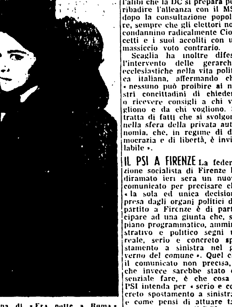
Giovanna Ralli in una scena di «Era notte a Roma»

Chiuso il Festival del cinema «Ballata di un soldato» ha vinto a S. Francisco Alla Ralli il premio per la migliore attrice Giovanna Ralli in una scena di «Era notte a Roma»