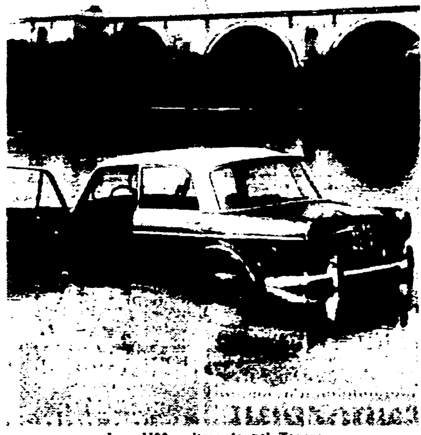
La «1100» ritrovata nel Tevere

Ignoti ladri, vandali, per giunta, hanno rubato l'auto notturno e l'hanno poi gettata nel Tevere. Ieri mattina la vettura è stata ritrovata nei pressi del ponte Flaminio, immersa nel fiume per circa un metro. Lanciata dalla strada, aveva percorso due tratti di scalinata e un tratto della scarpata in ripida discesa finendo con l'arrestarsi in acqua, dopo un volo