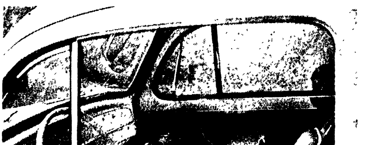
Il cadavere dell'ex colonnello (si intravede la testa della vittima) nell'auto trovata sotto Tiburtina