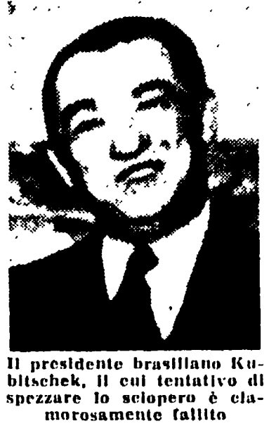
Il presidente brasiliano Kubitschek, il cui tentativo di spezzare lo sciopero era clamorosamente fallito

Attraverso tre quarti del continente sud-americano, la fine di ottobre e la prima quindicina di novembre hanno visto svilupparsi e concludersi scioperi senza precedenti per ampiezza e combattività, che vengono a porsi obiettivamente tra gli avvenimenti di maggior rilievo di questo dopoguerra.