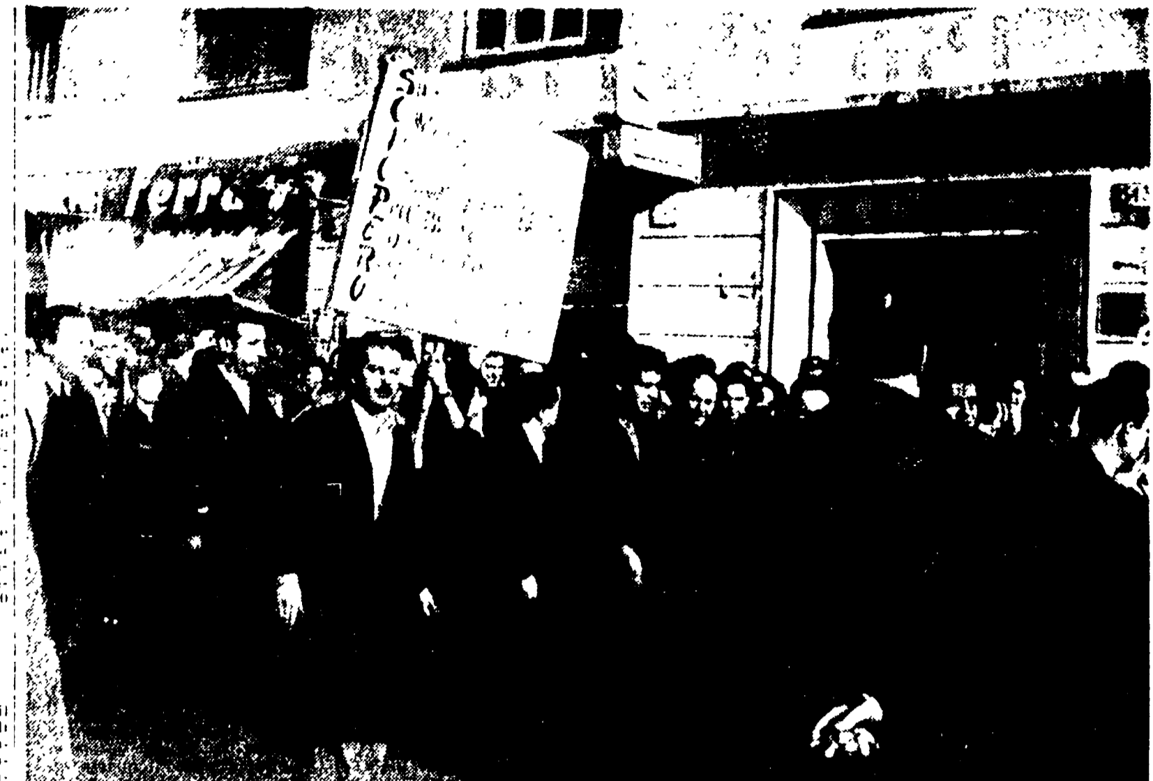
Il corteo dei lavoratori per le vie dell'Appio nel corso dello sciopero effettuato ieri mattina dai diecimila operai e impiegati della FATME. I manifestanti hanno denunciato il duro sfruttamento operato nei loro confronti dalla società.