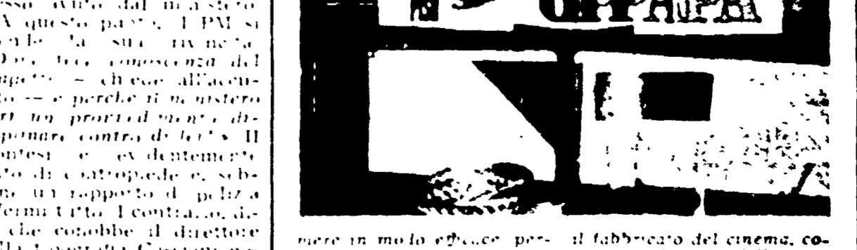
IL FILM « IL NOSTRO PARROCO »

Il ministero della Giustizia ha respinto le richieste di censura delle parrocchie MILANO 24 — Il ministero della Giustizia ha respinto le richieste di censura delle parrocchie. Il ministero della Giustizia ha respinto le richieste di censura delle parrocchie. Il ministero della Giustizia ha respinto le richieste di censura delle parrocchie. Il ministero della Giustizia ha respinto le richieste di censura delle parrocchie.