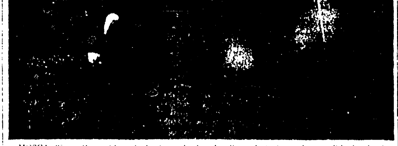
MOSCA, 25. — Il presidente finlandese Kekkonen ha lasciato la capitale sovietica diretto ad Helsinki dove è giunto dopo una breve sosta a Leningrado. Il presidente finnico è venuto in U.R.S.S. per la sua visita a Mosca. Il presidente finnico ha detto che l'apertura di questa importante via di navigazione interna sarà indubbiamente di grande utilità per l'economia del suo paese.

sta importante via di navigazione interna sarà indubbiamente di grande utilità per l'economia del suo paese. Per il commercio estero del paese, questa via aprirà grandi possibilità per lo sviluppo della Finlandia orientale. Kekkonen ha sottolineato che l'URSS ha dato prova di grande comprensione verso le questioni sollevate dalla Finlandia. «Possiamo rilevare ancora una volta che quando i requisiti fondamentali delle buone relazioni poggiano su solide basi, quando tra i paesi esi-