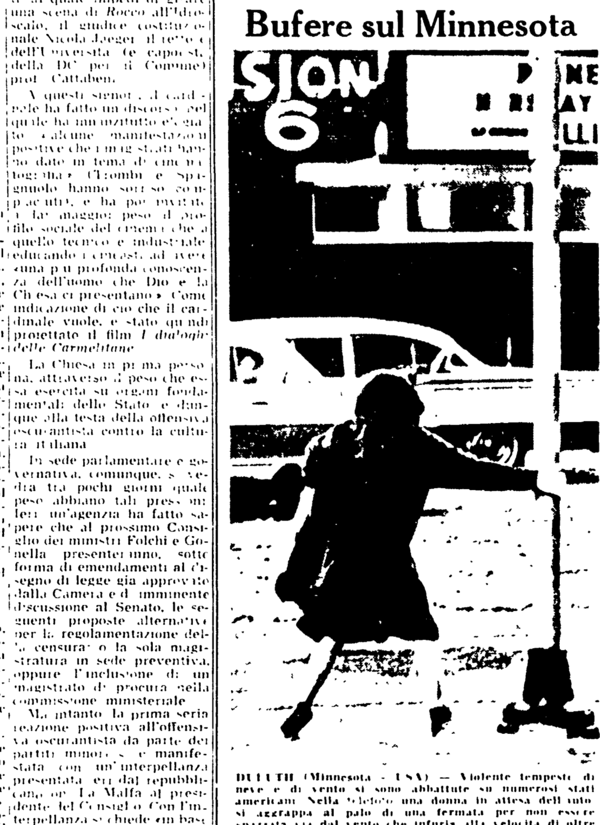
DUELT (Minnesota - USA) - Violente tempeste di neve e di vento si sono abbattute sui numerosi stati americani...

« Mostro è quello che possiamo fare, di queste belle contraddizioni, dieci anni di libertà... Massimo L. Salvadori, nel suo libro Il mito del buongoverno... »