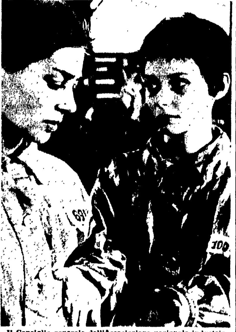
Il Consiglio generale dell'Associazione nazionale industrie cinematografiche (ANICA) ha designato ufficialmente, su proposta dell'Unione nazionale produttori film, il film «Kapò» diretto da Gillo Pontecorvo, quale concorrente all'Oscar per il miglior film straniero. Nella stessa seduta il Consiglio ha definito i criteri generali del premio che presenteranno per la nuova legge sulla censura. Nella foto: una scena di «Kapò» con Susan Strasberg (a destra)