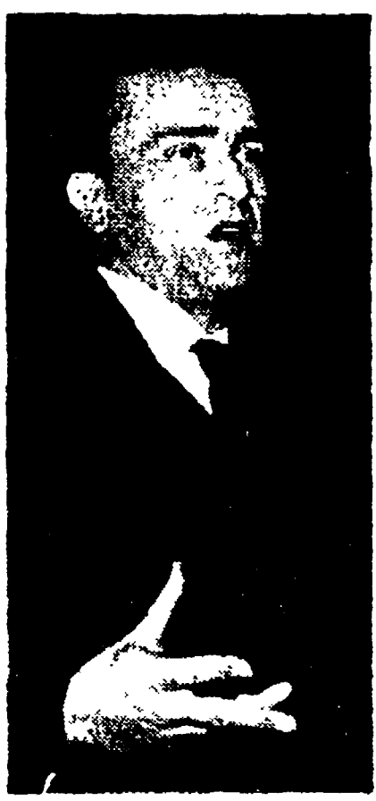
Il compagno Pietro Ingrao

Analisi dei risultati e indicazioni immediate e di prospettiva Il problema delle giunte e del governo - Il Mezzogiorno e l'attacco del capitalismo monopolistico - Adeguare le strutture organizzative del partito ai nuovi compiti della lotta politica