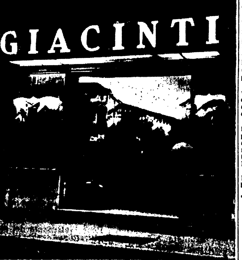
La vetrina di Giacinti: due volte, in quindici giorni, è stata obiettivo dei ladri