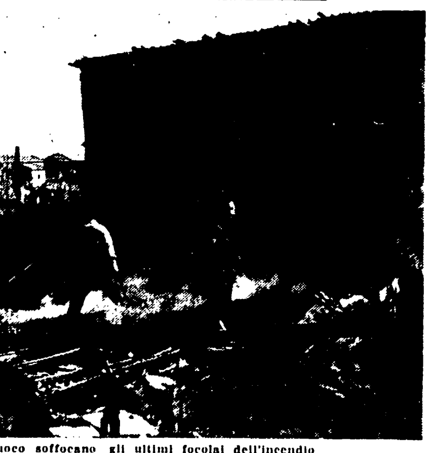
Lo scoppio di un barattolo di nitrocellulosa ha provocato l'incendio