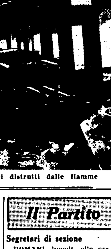
I vigili del fuoco soffocano gli ultimi focolai dell'incendio