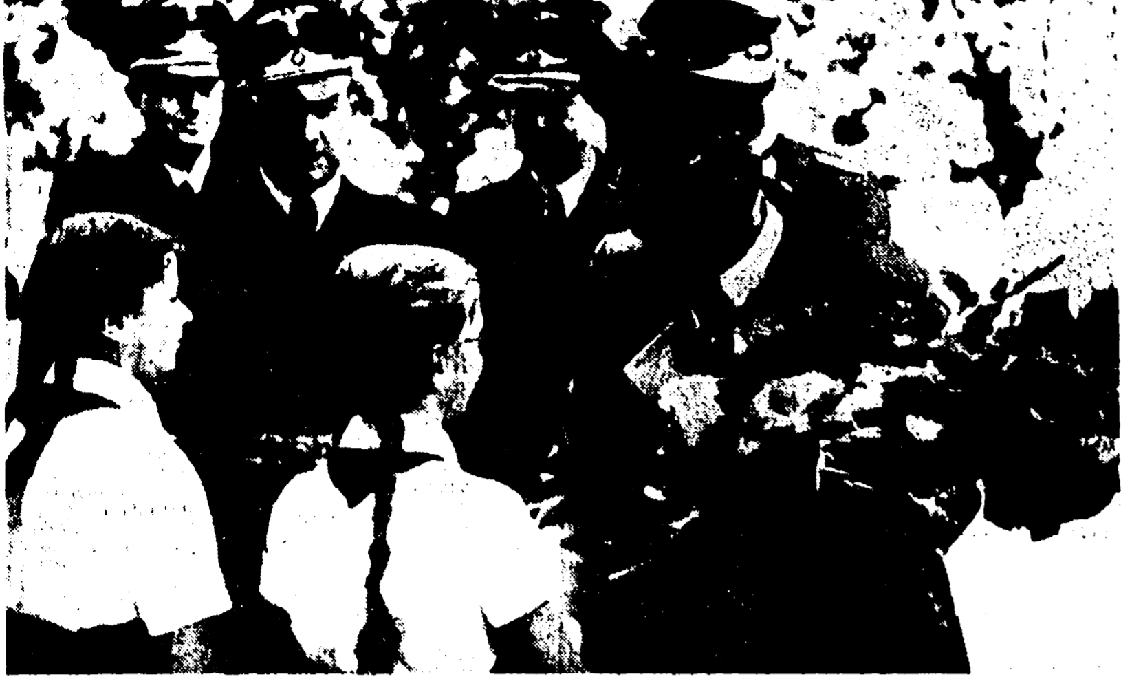
Globke, attuale ministro della Germania di Bonn (indicato dalla freccia) in divisa nazista al seguito del criminale di guerra Frick e al sindaco fantoccio di Bratislava in una foto scattata nel 1941 nella Cecoslovacchia occupata dai nazisti

Lo sterminio degli ebrei slovacchi portato a termine con fredda ferocia dal braccio destro di Adenauer