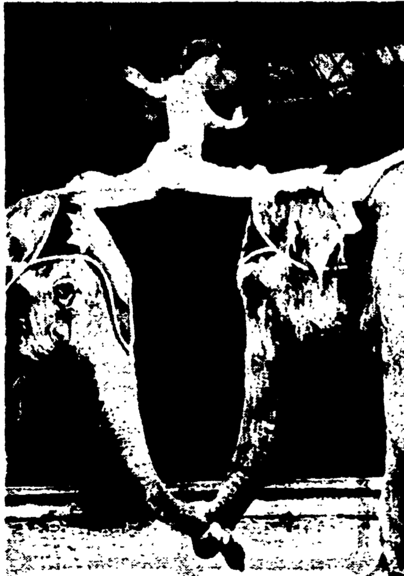
LONDRA - La graziosa acrobata Pia si esibisce in una spaccata sulla testa di due elefanti durante uno spettacolo presentato ad un pubblico di bambini all'Olympia di Londra.